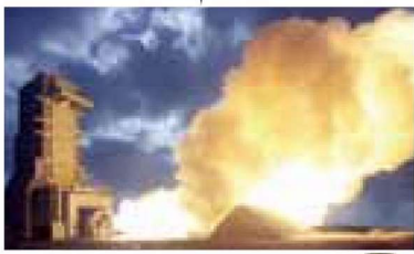
ノシロ共和国 秋田県能代市 能代ロケット実験場