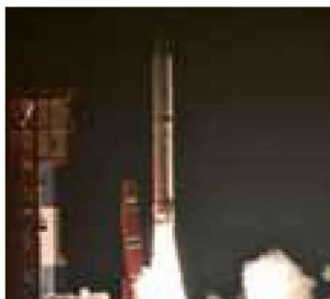
イプシロンロケット打上げ

今回打上げられた2号機では、「打上げ能力の向上(試験機に比べて30%向上)」と「搭載可能な衛星サイズの拡大」を実現しました。なお、2号機の第2段モータの地上燃焼試験は能代市の能代ロケット実験場で実施されました。