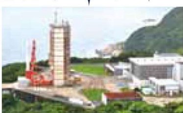
ウチノウラキモツキ共和国 鹿児島県肝付町 内之浦宇宙空間観測所