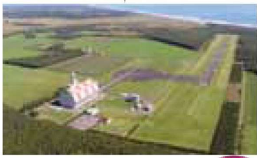
タイキ共和国 北海道大樹町 大樹航空宇宙実験場