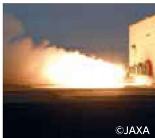
能代ロケット実験場