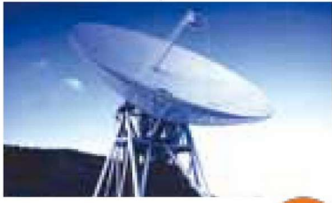
サク共和国 長野県佐久市 白田宇宙空間観測所